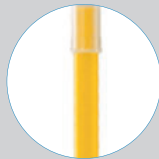
Tube de sortie réglable