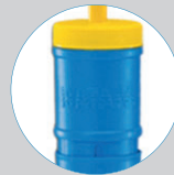
Actionnement ergonomique facile à utiliser